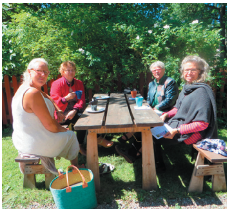
Kyrkkaffe på Pilgrimscentrum 3 och 17 juli.

Att dricka kaffe med dopp i solen efter högmässan lockar både många av kyrkbesökarna och andra gäster i staden.