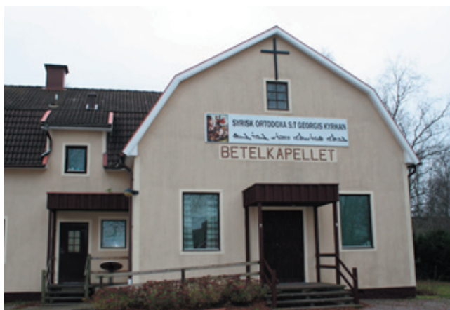
Den syrisk-ortodoxa kyrkan (f d Betelkapellet) i Maspelösa.

Studiecirkeln har en extra träff i januari och i februari startar vi en ny cirkel "Den grekisk-ortodoxa kyrkan", se bifogat informationsblad.