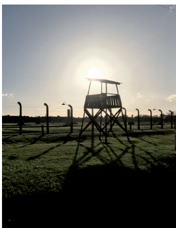
Bilder. Ovan t v: Wavel-slottet i Krakow, ovan t h: ingången till Auschwitz. Nedan t v: Vilda Vegehorn, Tove Svedell och Wilhelm Waldelind. Nedan t h: vaktorn i Auschwitz. Text: Björn Wänn.