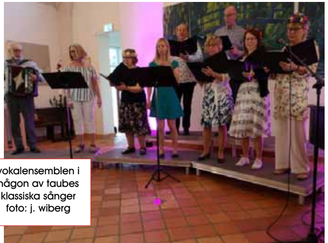
vokalensemblen i någon av taubes klassiska sånger