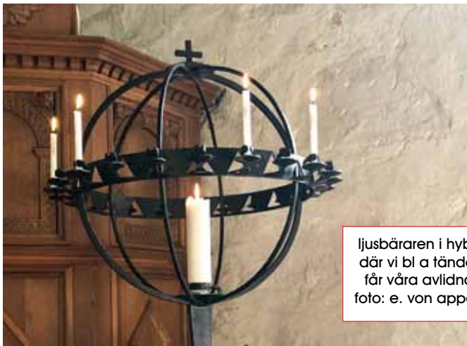
ljusbäraren i hyby där vi bl a tänder får våra avlidna