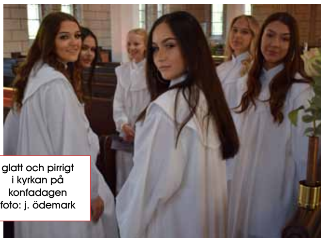
glatt och pirrigt i kyrkan på konfadagen