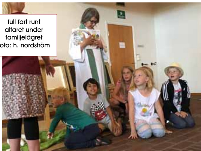
full fart runt altaret under familjelägret