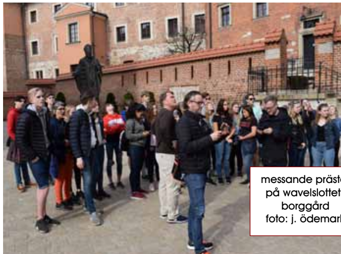
messande präster på wawelslottets borggård