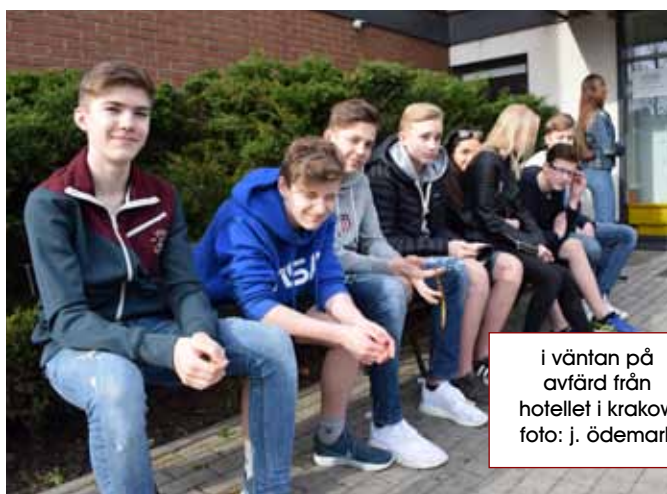
i väntan på avfärd från hotellet i krakow