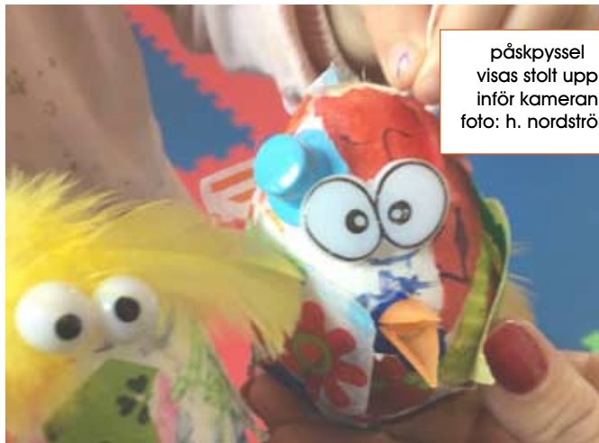
påskpyssel visas stolt upp inför kameran