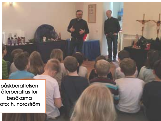
påskberättelsen återberättas för besökarna