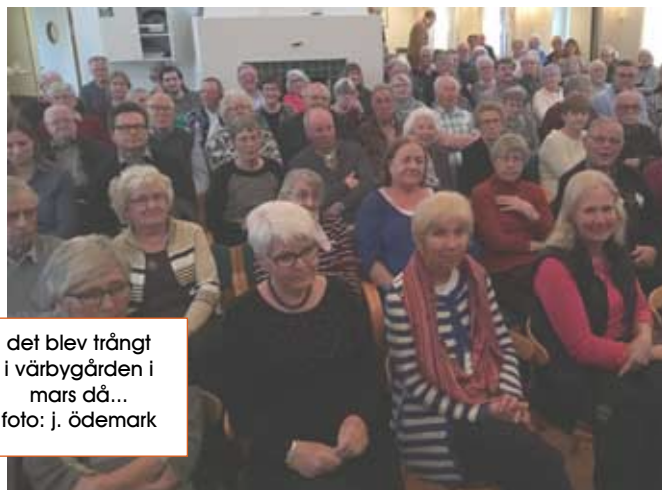
det blev trångt i värbygården i mars då...