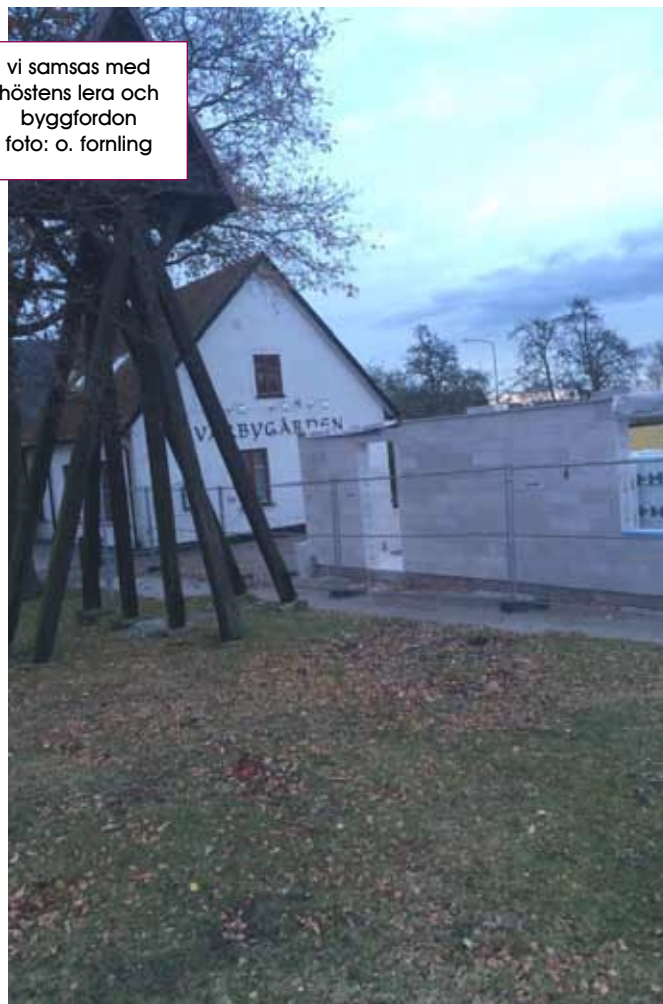
vi samsas med höstens lera och byggfordon