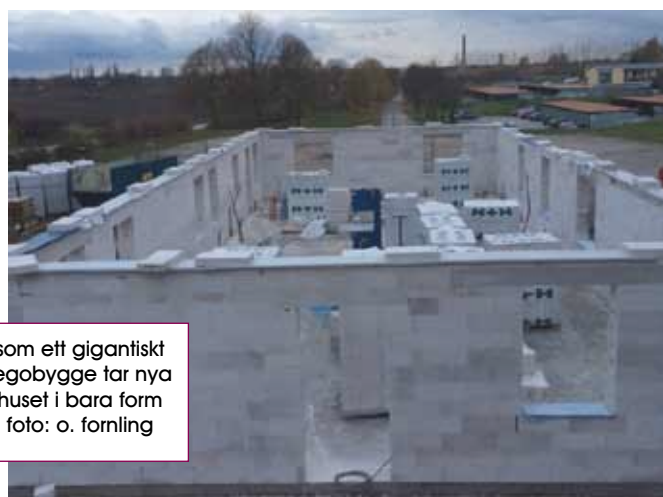
som ett gigantiskt legobygge tar nya huset i bara form