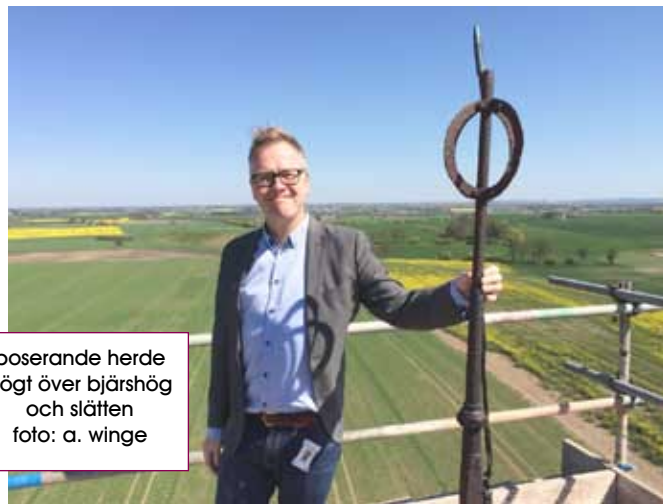
poserande herde högt över bjärshög och slätten