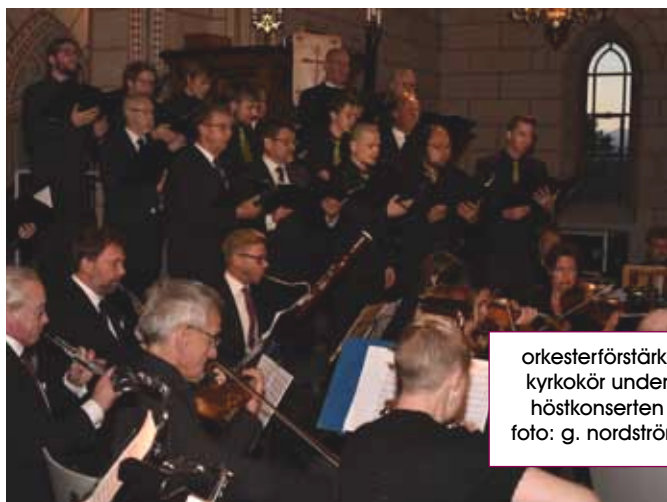
orkesterförstärkt kyrkokör under höstkonserten