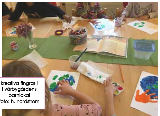
kreativa fingrar i värbygårdens barnlokal