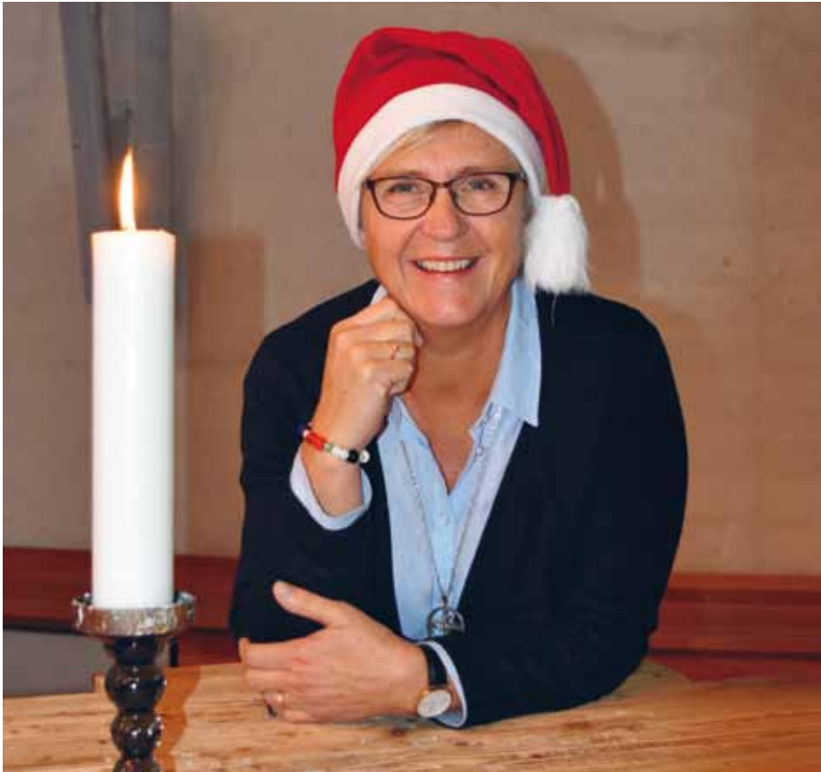
–Gemenskap, drop-in-julbord och dans kring granen kommer att vara program- punkter under julfirandet i Turebergskyrkan, berättar diakon Katharina Wolf Erixon.