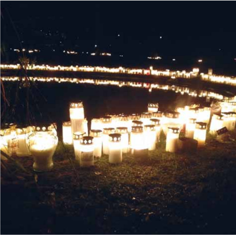
Allhelgonahelgen hjälper oss att minnas våra nära och kära.