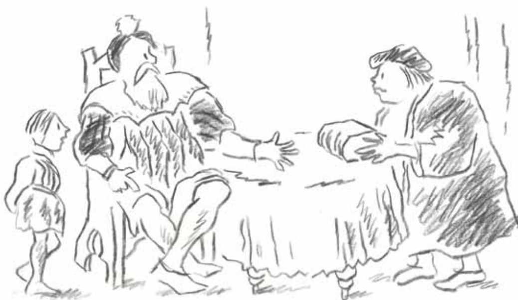
BIBLIA PÅ SWENSKO 1541 • FRITT EFTER JULIUS KRONBERG

Text: Hanna Wallsten kyrkporten@svenskakyrkan.se Illustration: Lennart Runow