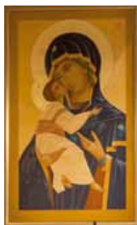
Målning: Sven-Bertil Svensson

som vill leka och leva..., bära och hålla människor, som Gud älskar.