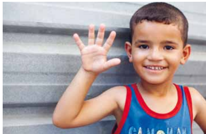
Zaid är ett av världens drygt 30 miljoner flyktingbarn.

Tillsammans hoppas vi kunna samla in 45 miljoner kronor under årets julkampanj. Med din hjälp kan det gå! Låt fler få fylla fem! KP