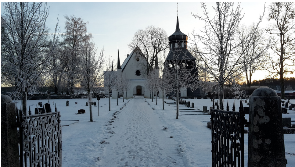
Tierps sockenkyrka januari 2018