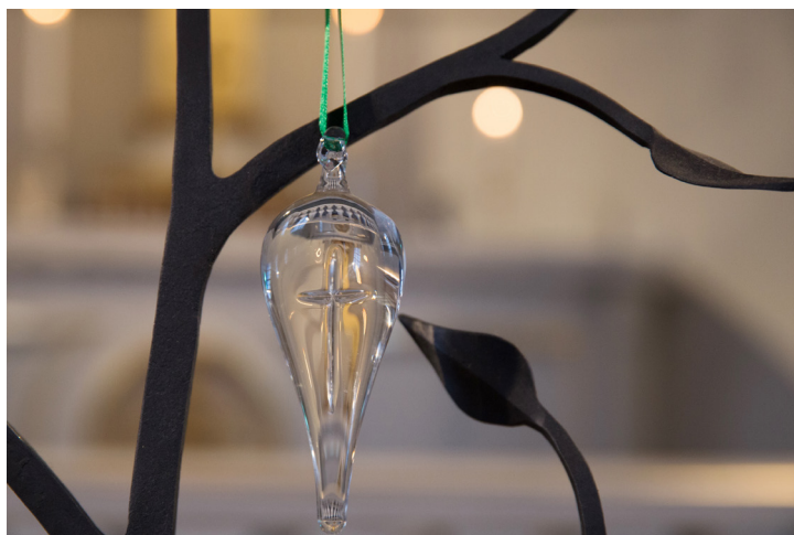
Församlingens gåva till den som döpts.

ord. Sedan får vi höra om hans liv, hans mirakler och förmåga att nå fram till människor. Till sist korsfästs han, dör och begravs. Jesus blir Kristus, den uppståndne Messias. För han uppstår, enligt många vittnen ända fram till idag!