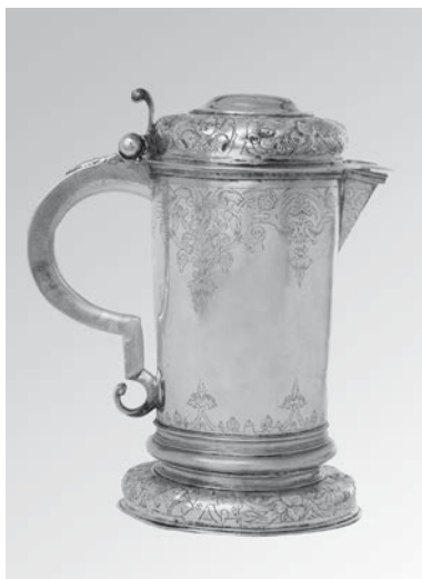
Vinkanna från 1646.

Nattvardskärnen är altarets främsta och egentliga prydnad. Sedan 1979 kan kyrkans silverskatt beskådas bakom glas i sakristians förrum. Av den medeltidskalk, som en gång tillhörde "Sancte Örjens gille" på Kopparberget finns sedan 1990 en kopia. Originalen förvaras på Statens historiska museem. Kalken, där nodens sex upphöjningar bär bokstäverna till gudsnamnet på hebreiska och dess 6-passformade fot är försedd med konstfulla inristningar, kompletterades 1994 med en patén försedd med motivet S:t Göran och draken. Den gamla trotzigiska kalken och patén från 1675 har en stramare utformning och kravet på dekorativ skönhet har fått vika för en mer funktionell utformning. Sockenbudskalken med tillhörande patén är från 1766.