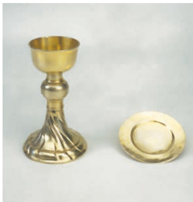
Sockenbudskalk och patén från 1766.