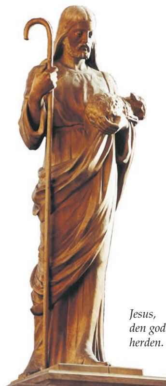
Jesus, den gode herden.

Väster om dörren till sakristian finns i väggen ett medeltida järnbeslaget skåp med utsökta sniderier i ek från medeltiden. Skåpet är troligen ett sakraments-skåp.