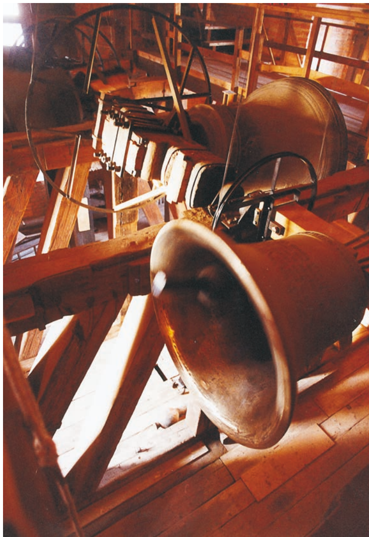
Kyrkklockorna sjunger ut bäst vid en utslagsvinkel av högst 90°.