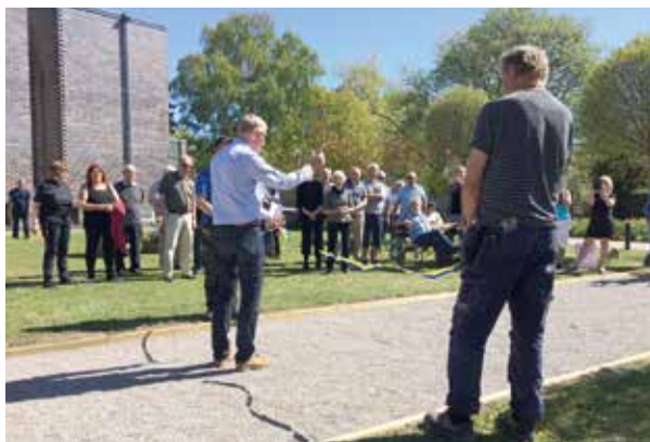
Invigning av boulebana

Församlingens kyrkogårdar har alltid öppet för den som vill besöka sina nära och käras viloplats. Måndag till fredag håller vi dessutom gårdarna bemannade 07 till 16.