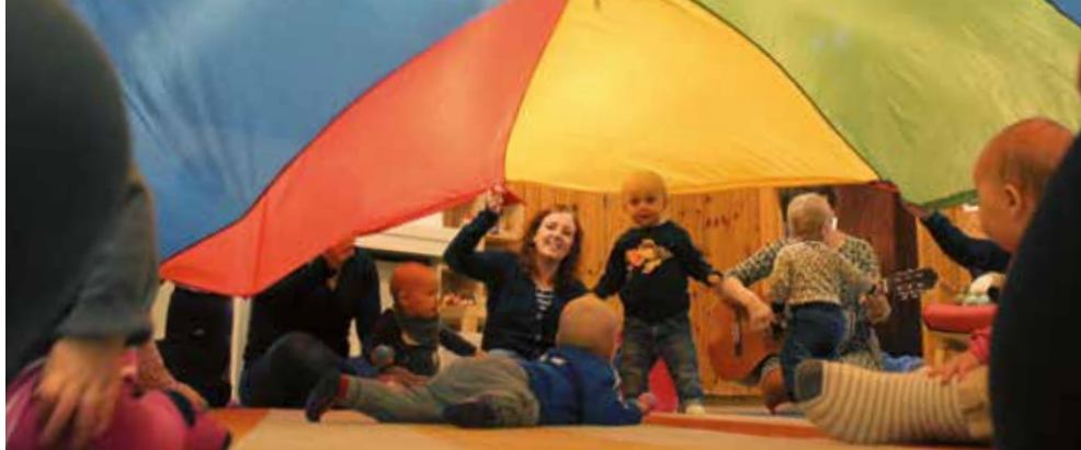
Klapp och Klang

borgskyrkan. 28 september, 26 oktober och 30 november. 30 kronor för vuxna, och ingen kostnad för barn. Även på Terra Nova kyrkan kommer ett liknande koncept att starta senare i höst, och vi hänvisar till hemsidan för exakta tider när det blir dags.