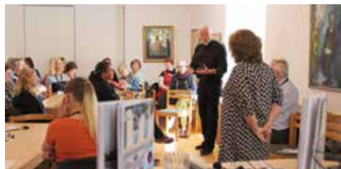
Seminarium under Gotlands kyrkvecka

Visborgskyrkan klockan 17.00. Kostnad 80 kronor. Anmälan krävs, och höstens tillfällen är 24 september, 22 oktober, 19 november och 17 december.