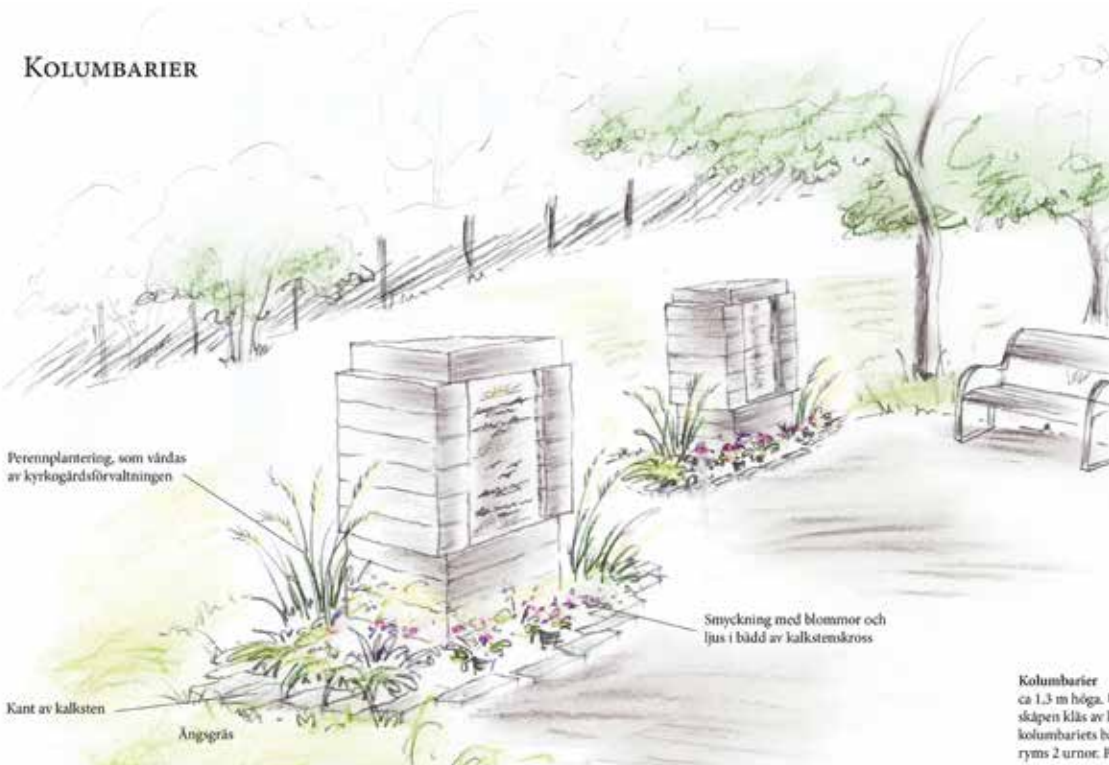
Perennplantering, som vårdas av kyrkogårdsförvaltningen