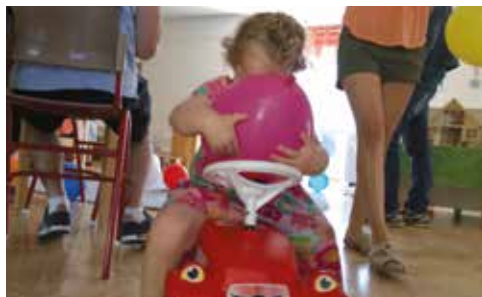
Förskolan i Terra Nova kyrkan.

Alltid klockan 09.00 till 11.30 på tisdagar, torsdagar och fredagar i Visborgskyrkan. Terra Nova kyrkan renoveras för närvarande