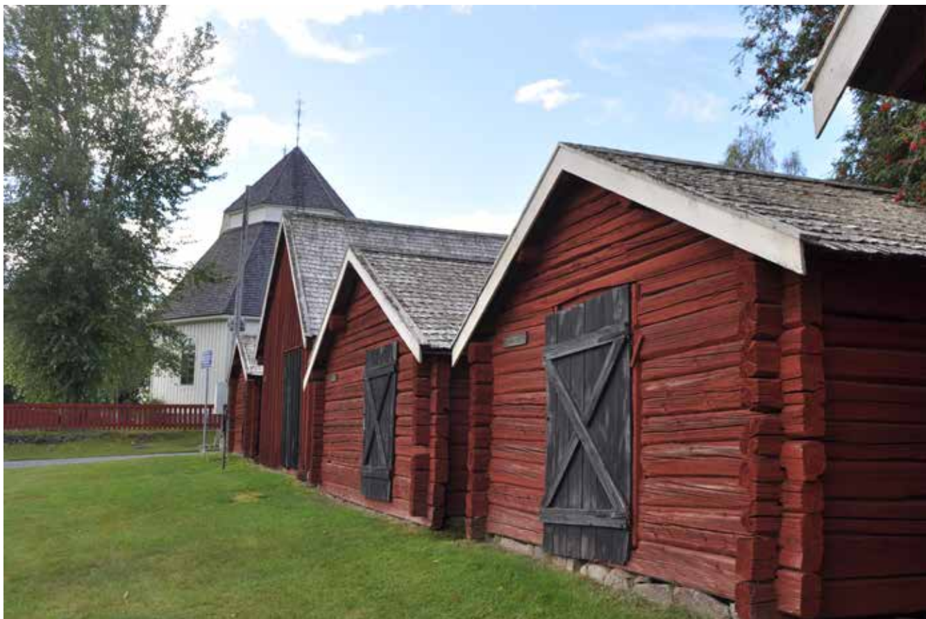
Kyrkstallarna utanför kyrkan uppfördes i slutet av 1700-talet.