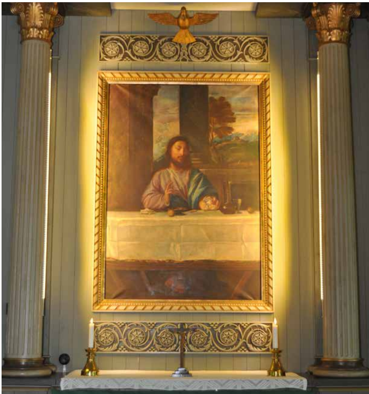
Altartavlan är en kopia av Tizians målning "Nattvarden", målad i Louvren, Paris, av konstnären Stig Bergh, Stockholm.

Den första kyrkan i Viksjö invigdes 1771, men redan efter 20 år hade den tjänat ut. I stället för att bygga en ny kyrka flyttades brukskapellet från Västanå till kyrkans nuvarande plats. På 1790-talet köptes också klockstapeln från Högsjö gamla kyrka och uppfördes på sin nuvarande plats. Kyrkan renoverades 1891 och 1925, men den 8 februari 1926 brann den ner till grunden efter att kaminens plåtrör hade antänt sågspånen på innertaket. Genom en dramatisk räddningsinsats kunde kyrkkistan, innehållande bl a en svart mässhake, tennljusstakar från 1700-talet och en Karl XII-bibel, räddas från lågornas rov. En ny kyrka uppfördes 1927-28 efter ritningar av Härnösandsarkitekten David Frykholm. 1964 målades kyrkan invändigt och 2011-2012 skedde en utvändig renovering, då bl a spåntaket från 1959 tjärades med dalbränd trätjära.