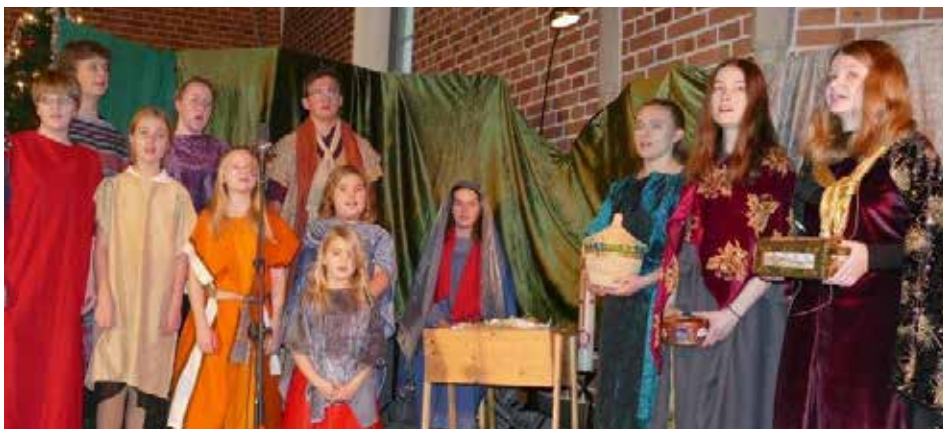
Delar av den ensemble som medverkade i fjolårets julspelet 2016.