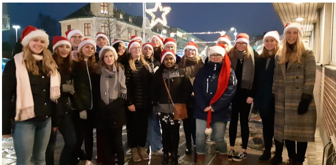
Jubilatekören sjöng på juls skyltningen i Älmhult.