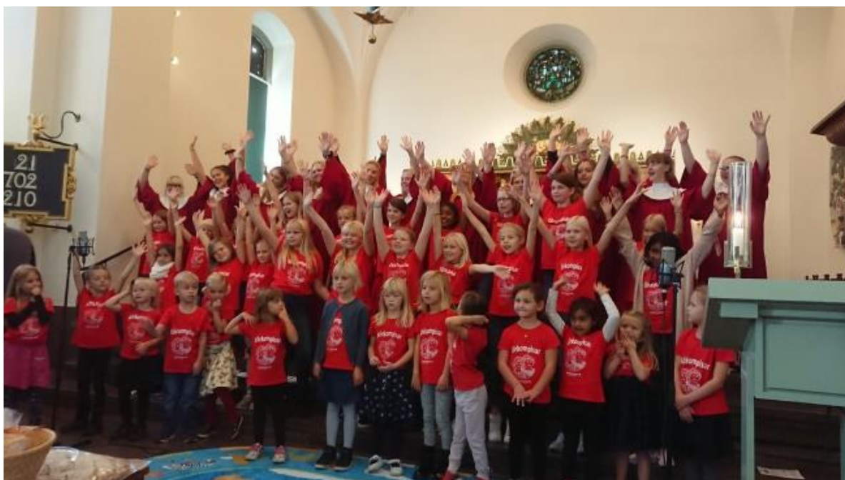
Familjegudstjänst med Unga Röster, Barnkören och Jubilatekören