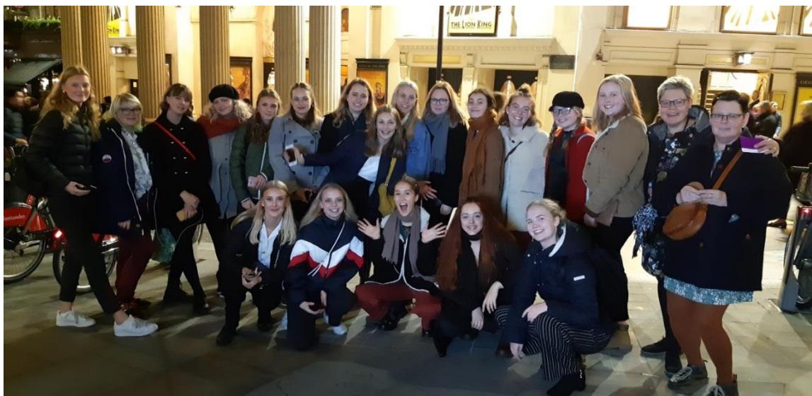
Jubilatekören i London utanför teatern där vi såg musikalen Lejonkungen.

Jubilatekören spred skönsång i butikerna i Älmhult under juls skyltningen. Ett mycket uppskattat inslag i det mörka, slaskiga vintervädret som var på kvällen.