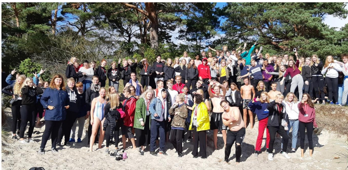
K04 läger gemensamt för hela kommunen

Terminen inleddes med en gemensam inskrivning i kyrkan. Veckan efter hade vi kyrkorumsbingo. Vi åkte på ett gemensamt läger för båda grupperna tillsammans med Stenbrohult och Virestad - K04. Lägret var i Åhus och totalt var vi 150 personer. Det var oerhört lyckat. En av ungdomarna beskrev det efteråt som den bästa helgen i hennes liv och att hon efteråt låg på sin säng med knäppta händer och kände frid för första gången.