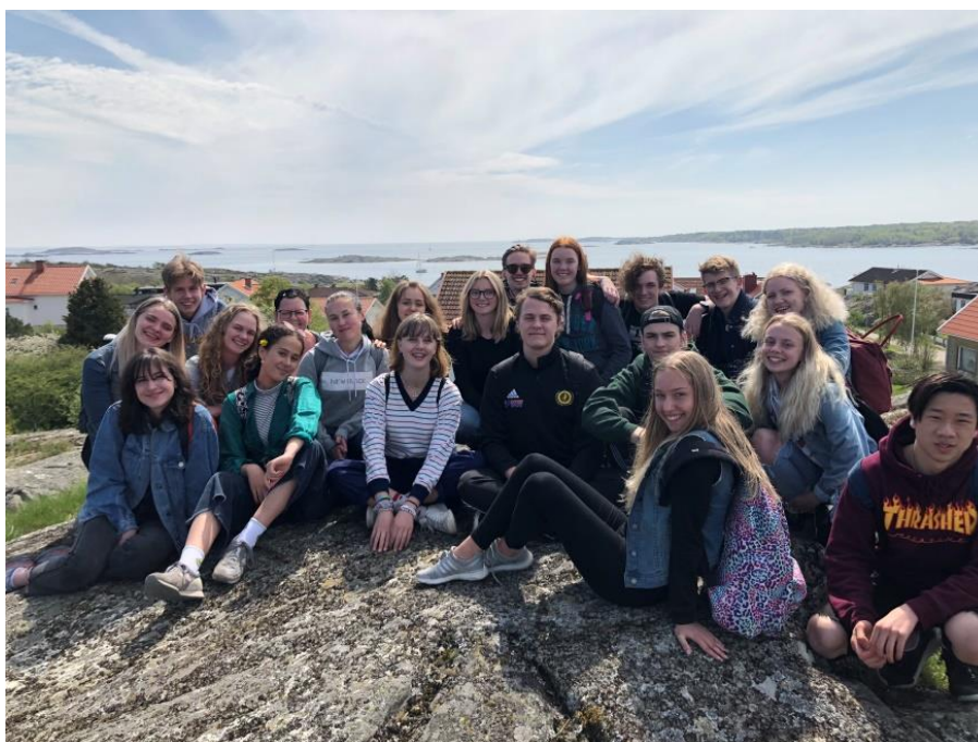
DELUX vid havet

Många från Delux var också med som faddrar på terminsgruppen och lovgruppens läger.