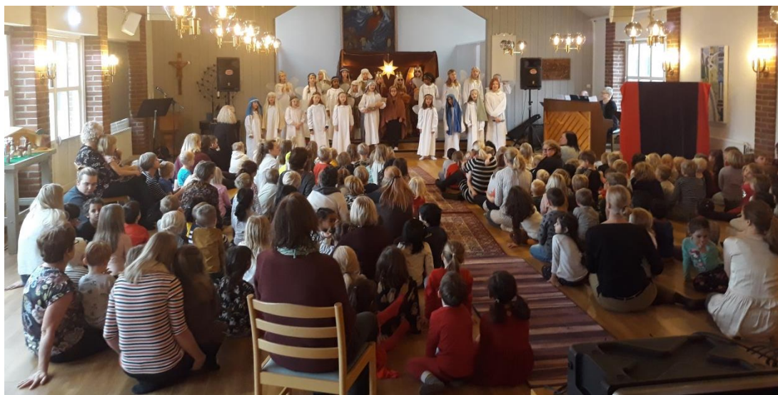
Älmhults förskolebarn med personal är och tittar på musikalen "En lysande stjärna" i församlingshemmet.

Under hösten övade vi in ännu en musikal "En lysande stjärna" som spelades upp för ca 350 förskolebarn som vi bjöd in i början av december. Även församlingen fick ta del musikalen som också framfördes i samband med gudstjänsten på Trettondedag Jul.