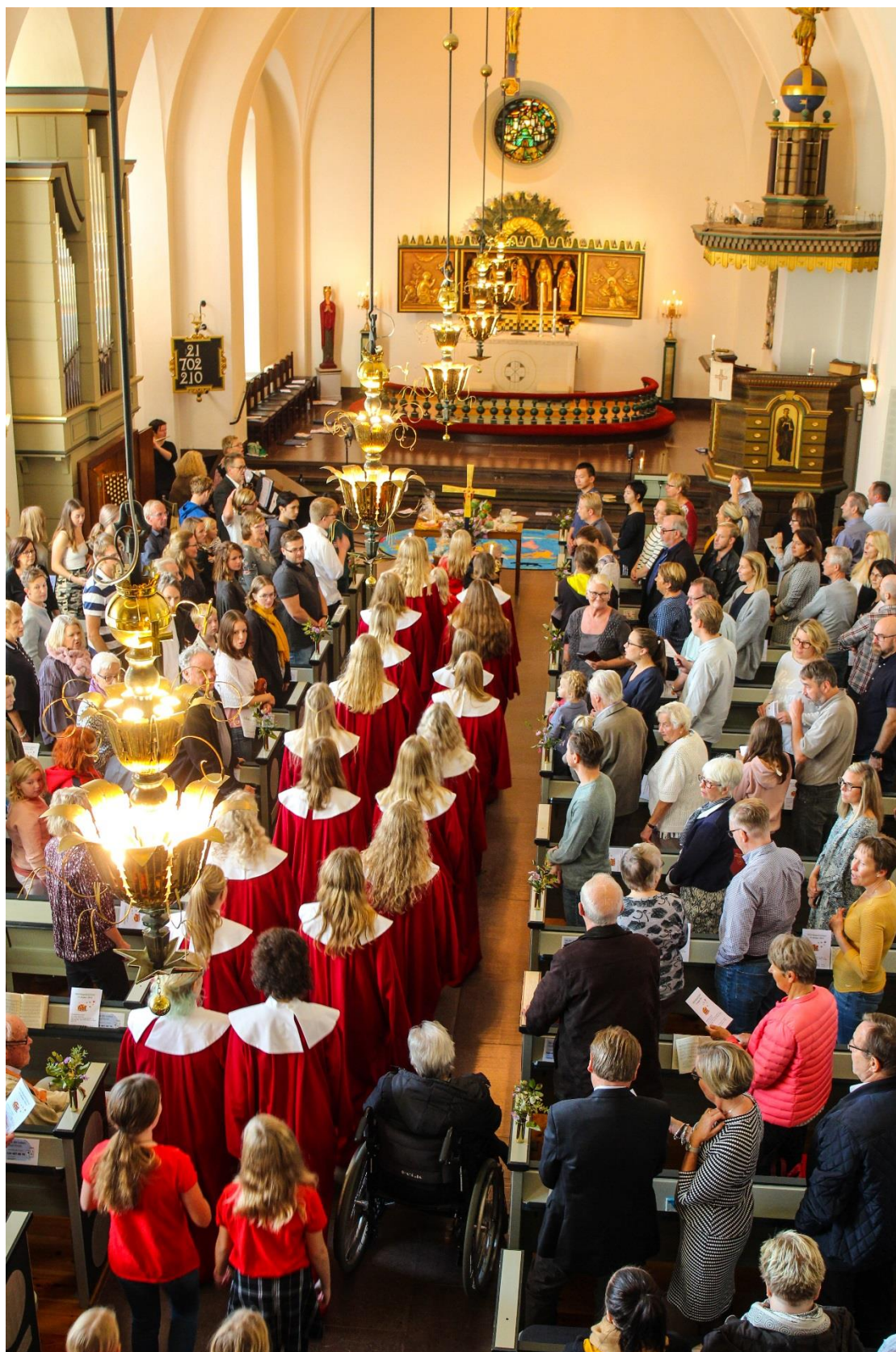
Procession på Tacksägelsedagen 14 oktober i Älmhults kyrka