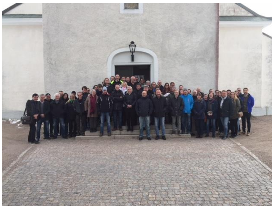
Vaktmästardag i Berga

Under den årliga fotbollsskolan i samarbete med Stenbrohult ställer vi upp med personal, tält och staket.