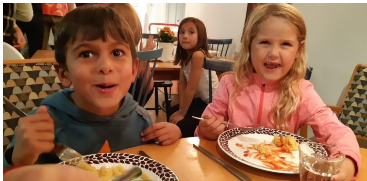
Pastakväll är toppen

Alla uppskattade maten och de goda senglorna och pinatan i form av ett hjärta fylld av små nallebjörnar.