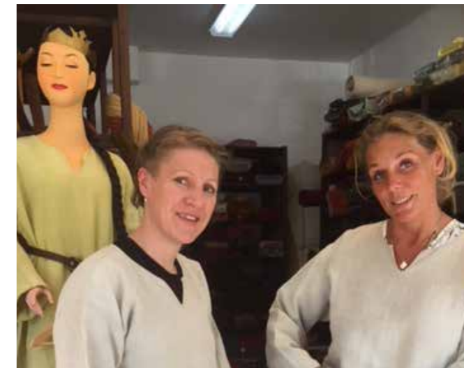
Klädprovning inför Birka-vistelsen