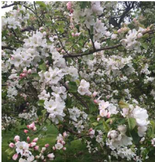
Blommande äppelträd på Adelsö