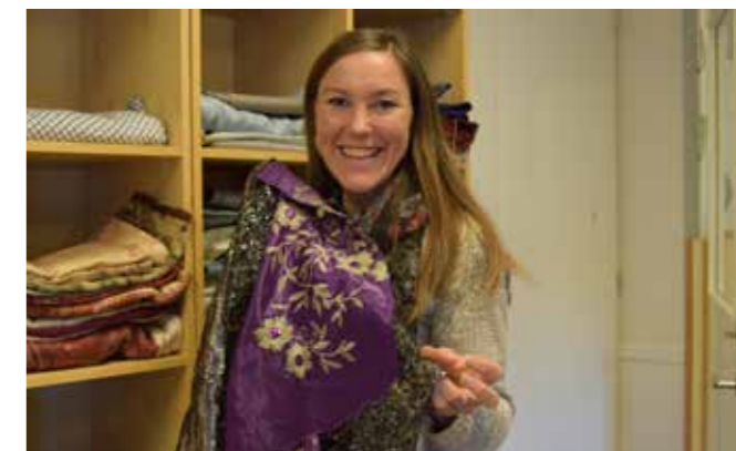
Tyger klara att användas i syverkstan