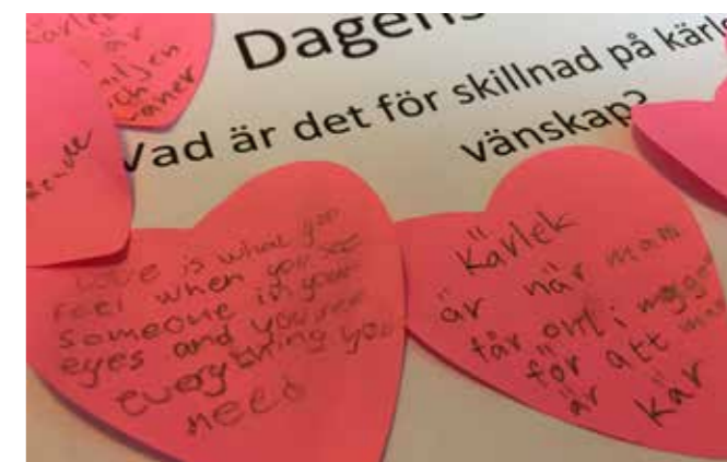
Temat ”kärlek” på Gud och spagetti