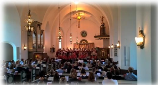
Familjemässa 23 e Trefaldighet med Jubilatekören och Unga Röster