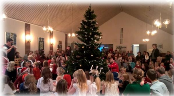
Julfest i församlingshemmet