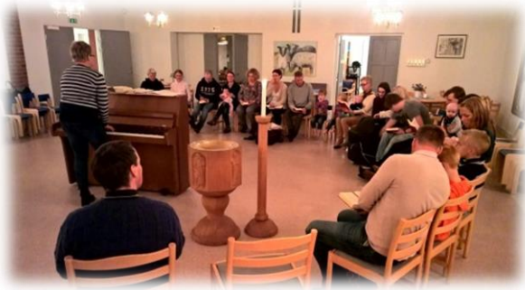
Dopträff i församlingshemmet