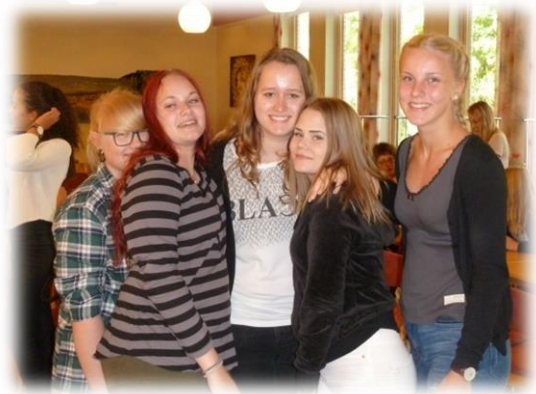
Ungdomskördag i Jönköping 26 sep.

Jubilatekören har ca 25 körsångare. Varje körövning inleds med fika och det är mycket uppskattat. Två gånger under terminen medverkade kören vid välgörenhetskonsserter. På våren till förmån för Cancerfonden och på hösten tillsammans med Feed International. Vid båda tillfällena samverkade kören med olika solister. För tredje året i rad sjöng kören vid Påsknattsmässan. En spännande upplevelse för många där avslutningen med pizza är väldigt uppskattat! Kören är mycket aktiv vid församlingens konfirmandhelger samt vid de årliga konfirmationerna (4-5 st./år). I september månad reste kören på en Ungdomskördag till Jönköping och där fick tjejerna träffa andra ungdomar som sjunger samt lära sig många nya sånger.