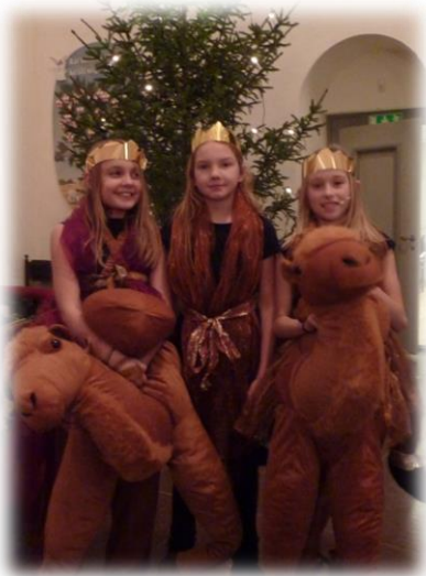
"De tre vise männen"

Under december månad övade vi in ännu en nyskriven musikal "En lysande stjärna" som spelades upp för ca 300 förskolebarn. Den innehöll bland annat "rappande" vise män som blev en stor succé. Även församlingen fick ta del av musikalen som också framfördes i samband med gudstjänsten på Trettondedag Jul. Glädjande för mig personligen är att Familjegudstjänsterna samlar mycket folk och det kan vi nog tacka alla flitiga körsångare och deras familjer för, som så gott som alltid kommer mycket troget till kyrkan vid uppsjungningar. De har en mycket god kördisciplin!