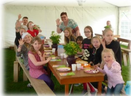
Söndagsskola i sommartältet