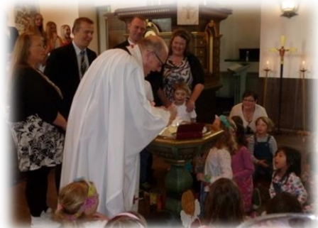
Familjegudstjänst med dop