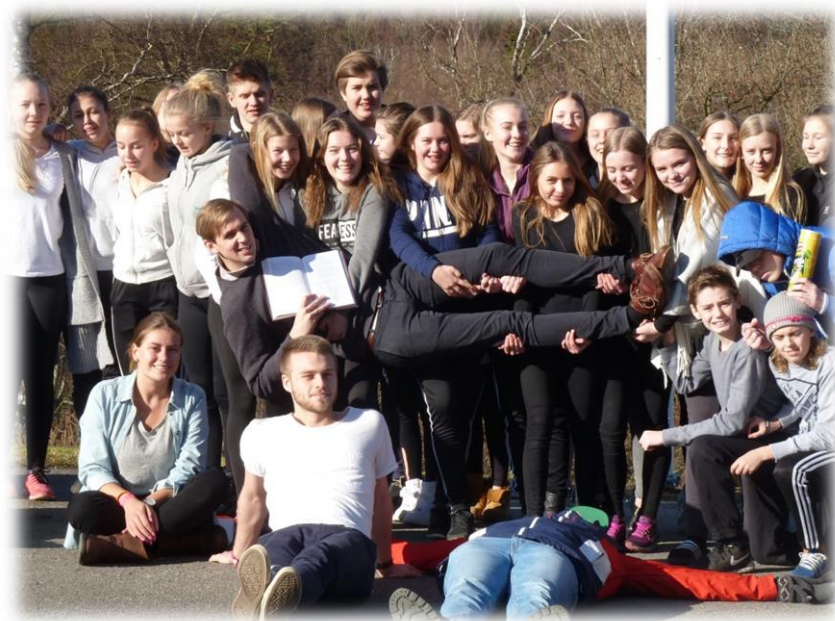
Konfirmander på läger födda 2001