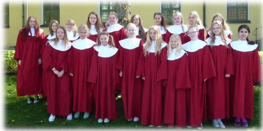
Jubilatekören våren 2015

Jag lägger mycket av min arbetstid på konfirmandarbetet i vår församling, som jag anser är en av mina viktigaste uppgifter. Det blir många läger och konfirmandhelger och där har musiken tillsammans med orden en stor och viktig roll. Bland dagens ungdomar är stunder av eftertänksamhet en bristvara. Behovet av att bli sedda, få förbön och samtal är oerhört stort. Där har kyrkan och vi som anställda en mycket stor uppgift att ta oss an och vårda. Tack för ännu ett härligt år i en levande och aktiv församling!