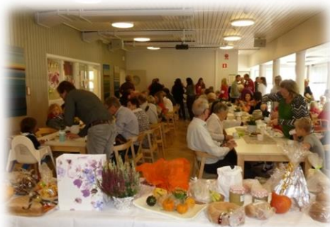
Kyrkkaffe på Tacksägelsedagen