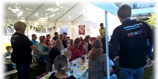
Trollerishow vid Älmhultsdagarna