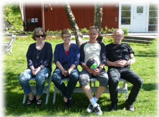
Gökotta i Råshult