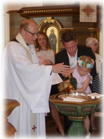
Dop i Älmhults kyrka