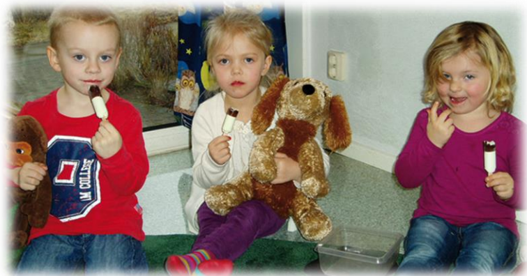
Gosedjursdag i Ceciliagruppen

Här träffas barn från 3 års ålder varje måndag. Gruppen har under 2014 träffats 37 gånger och sammanlagt har ca 25 barn varit med. Barnen målar, ritat och gör egna arbetsblad som anknyter till bibelberättelser. Vi sjunger, leker och pysslar mycket, och berättar ur Barnens Bibel och andra böcker. Vi upplever det som en mycket viktig och rolig verksamhet där vi når barnen direkt med kyrkans budskap.