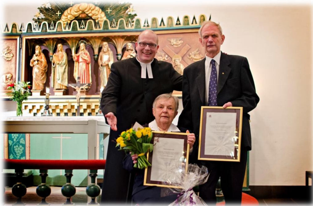
Engagerade lekmän får diplom