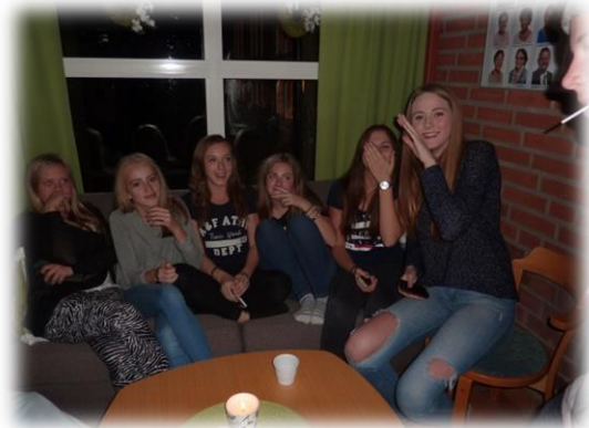
Ungdomskväll i församlingshemmet

Jag lägger mycket av min arbetstid på konfirmandarbetet. Det är 3-4 läger varje år, konfirmandhelger, terminsläsning, sommarkonfirmander och mycket mer. Varje vecka sjunger jag med tisdagsgruppen samt är också med vid andra aktiviteter som t. ex. ungdomskvällen vi hade den 17 oktober där konfirmander och konfa-team från hela vår kommun umgicks, lyssnade på My dear Addiction samt åt pizza tillsammans. En härlig kväll!