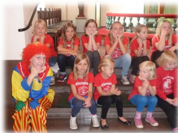
Söndis med körbarn