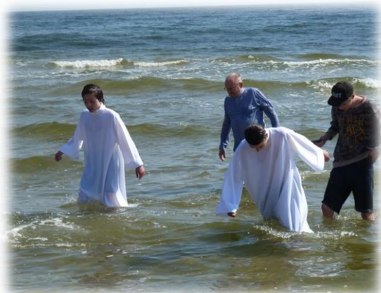
Konfirmanddop i Åhus