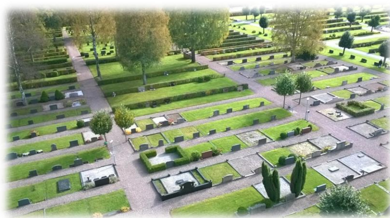
Älmhults gamla kyrkogård