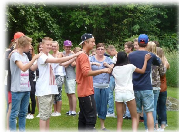
Malin med sommarkonfirmander