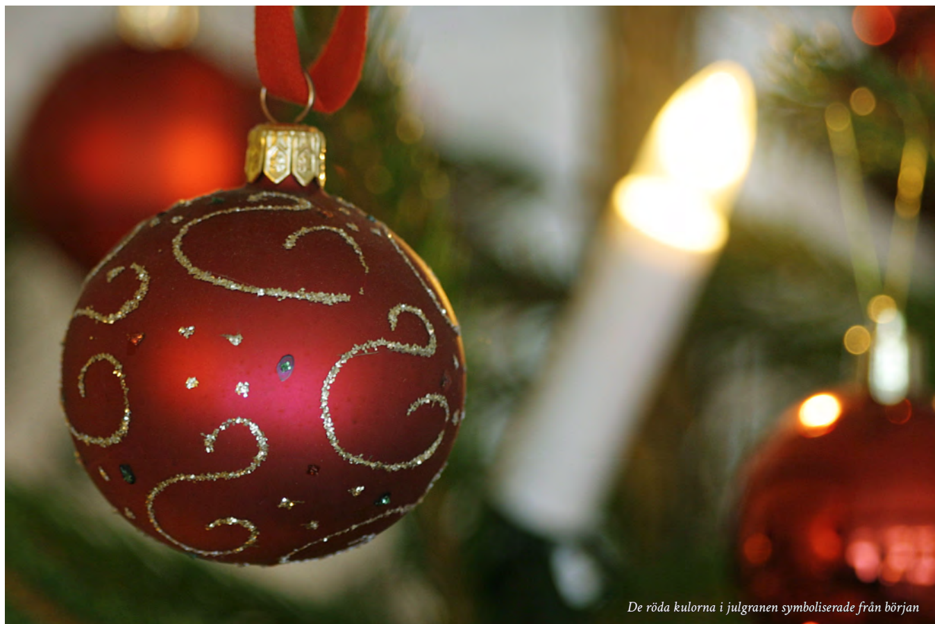
De röda kulorna i julgranen symboliserade från början