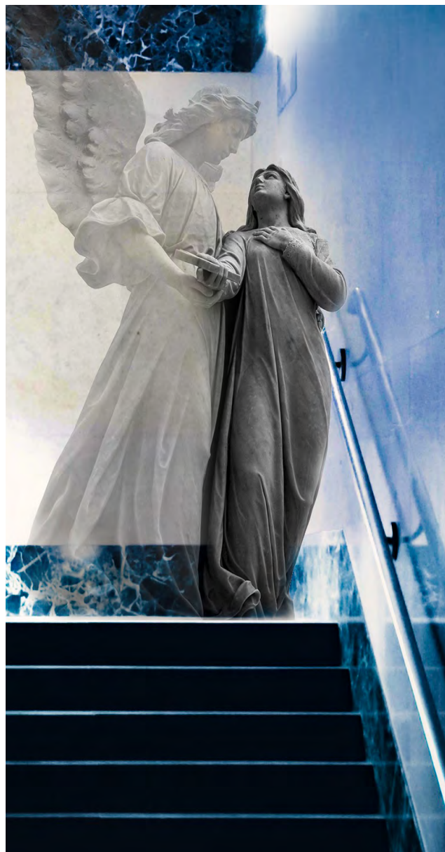
TEXT TITTI FABRITIUS

Louise bodde på översta våningen, men vågade inte gå in i hissen eftersom mannen fortfarande följde efter henne. Istället vände hon tillbaka och började springa uppför trapporna. Det var ett äldre hyreshus utan automatiskt ljus, så det var mycket mörkt. Det hindrade inte mannen som sprang efter och snart kom ifatt henne. Då han fick tag på henne, slog han ner henne till golvet. När hon landade på golvet bad hon Gud om hjälp och ropade flera gånger "Jesus! Jesus, hjälp mig!" Hon var livrädd för vad mannen skulle göra med henne. Plötsligt blev det ljust. Louise trodde att det skulle komma någon, men inget hördes. Mannen däremot blev rädd, släppte taget och sprang iväg nerför trapporna och