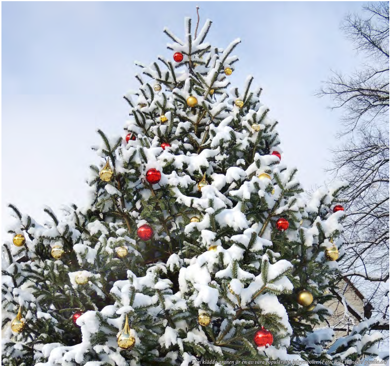
Den klädda granen är en av våra populäraste julsymboler.