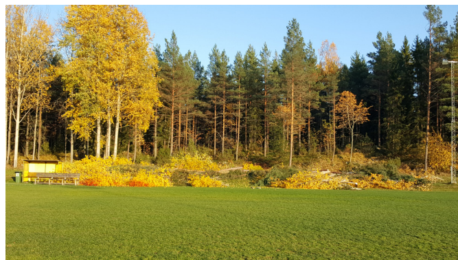
Här i skogsbrynet ska den handikappanpassade aktivitetsytan placeras.

Utöver detta kommer år 2019 kännetecknas av att vi koncentrerar resurserna till att utveckla framtidens Hille IP. Det gör vi genom projekten: