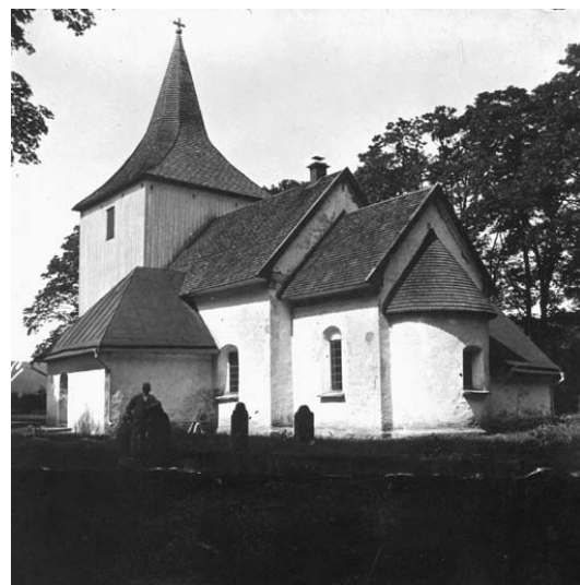
Väversunda kyrka 1952 och th utan årtal.