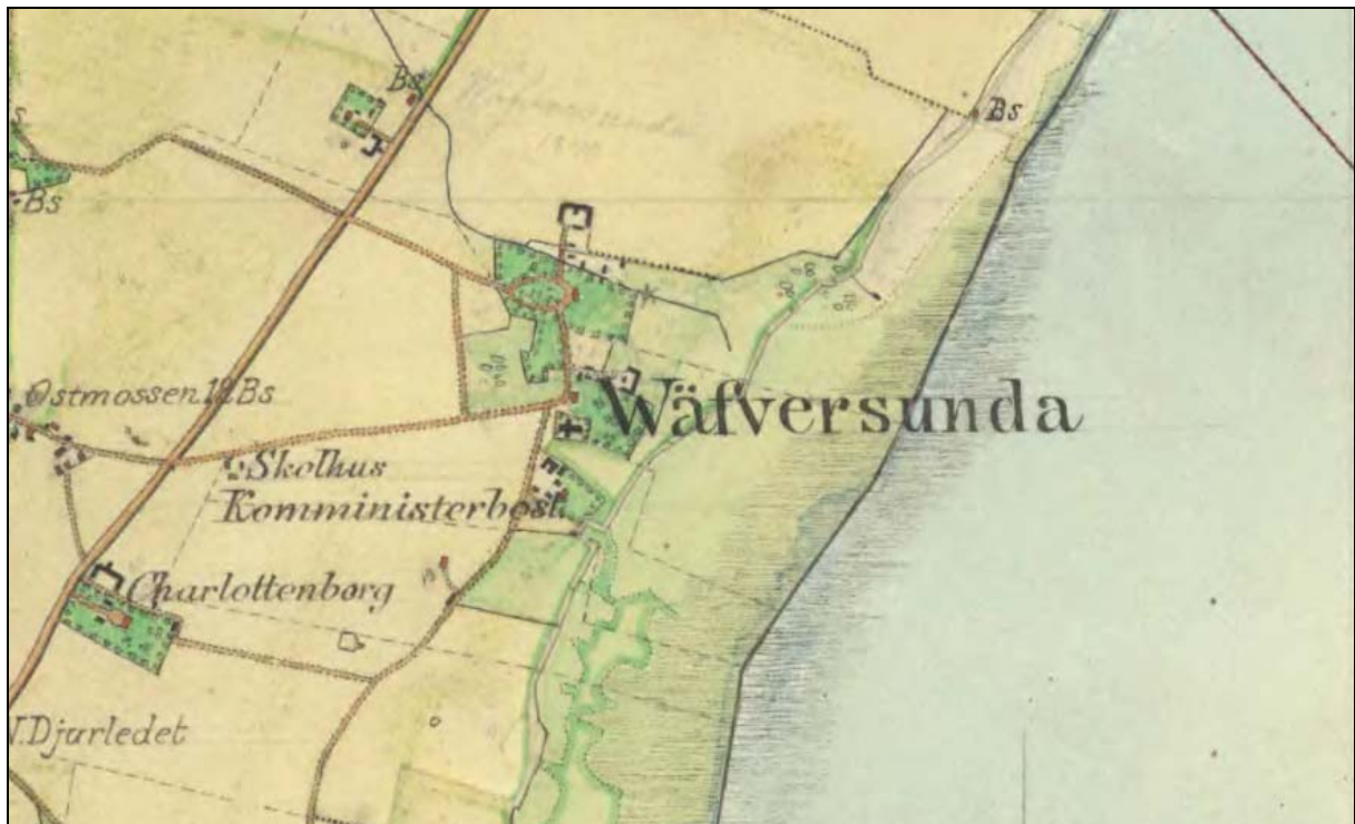
Utdrag ur Häradsekonomisk karta 1868-1877, Tåkern