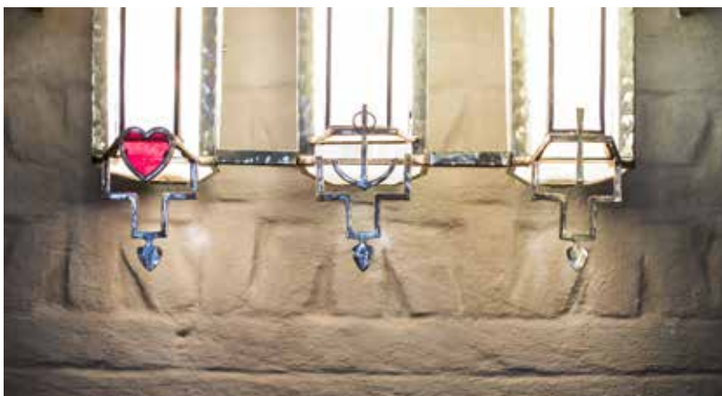
"Nu består tro hopp och kärlek, dessa tre, och störst av dem är kärleken". (1 Kor. 13:13)

I det läge världen idag befinner sig handlar det om att vi har tillit till ansvariga politiker och beslutsfattare. Det handlar också om tillit till varandra med respekt att inte förvärra situationen. Vi behöver alla åtlyda de föreskrifter och uppmaningar som ledande beslutsfattare ger oss.