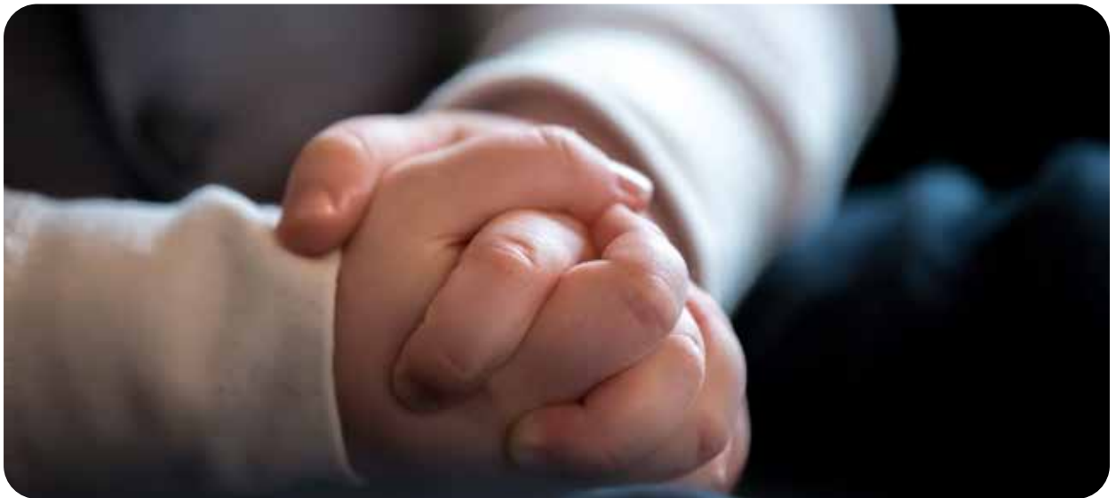
Händer i bön.