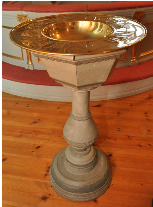
På dopskålen av mässing finns inskriptionen "Till minne av Generalkonsul Gustaf Nordling, född i Stigsjö 31 juli 1853, död i Cepoy 20 september 1916."