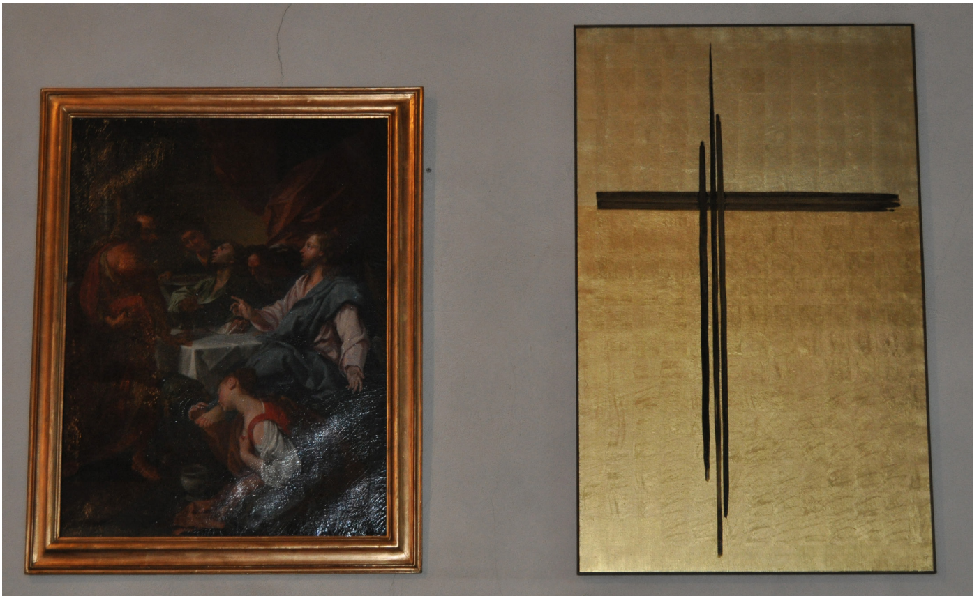
Tavlan till vänster föreställer "Synderskan i fariséernas hus torkande Jesu fötter". Konstnären är okänd. Målningen i bladguld av Arne Olsson i Örnsköldsvik har tidigare varit altartavla i Sörgårdens kapell, Gussjö.