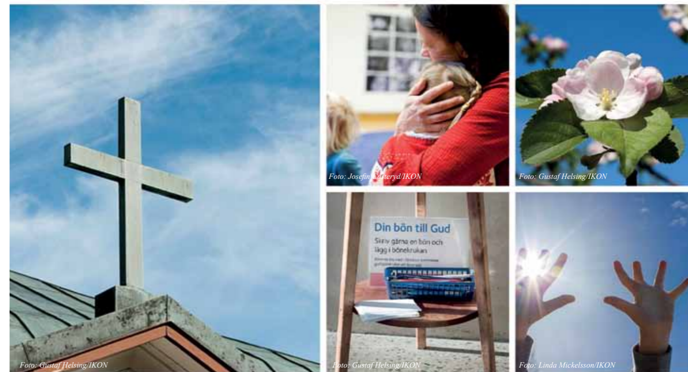
Text: Manne Bennehed