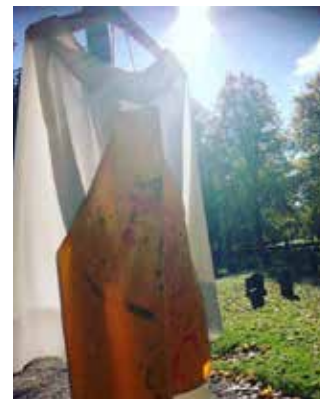
Röcklin och förkläde