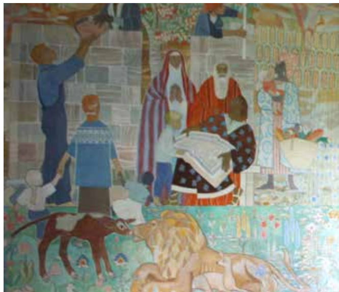
Ovan: konstverket i Stora Salen ger färginspiration!