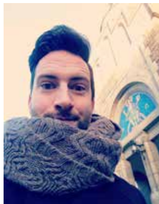
Petter på prästkurs i Göteborg

Prästutbildningen är lång och ibland undrar folk vad det är man egentligen gör. "Läser ni Bibeln hela tiden?" Och svaret är ungefär "Ja, fast nej..." I teologin finns förstås Bibeln och tron i centrum, men vi tittar på det från olika håll i olika kurser. I exegetiken är Bibeln i fokus, då läser man nära. Översätter från grekiskan (Nya testamentet är från början skrivet på grekiska), lär sig om tiden, platsen och kulturen där olika bibeltexter kommit till. Vad vet vi om dem och hur? Så finns systematisk teologi och historisk och praktisk teologi, som man skulle kunna säga handlar om hur kristen tro har formulerats förr och nu. Och hur formulerar jag den? Så finns det kyrkohistoria, religions-