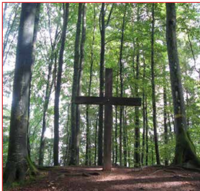
Korset på Dullaberget i Femsjö.

Det blir som en bild av ”mitt” inre. Rensa bort det som har vissnat av tankar och drömmar, för att bereda