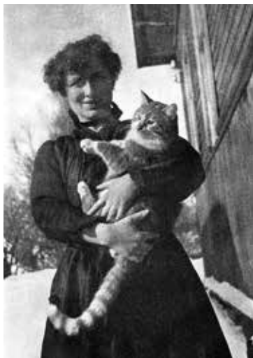
Edith Södergran var en hängiven amatörfotograf.

Utställningen finns att låna via www.kultursamverkan.se