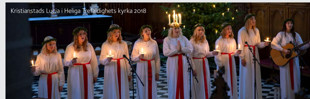
Kristianstads Lucia i Heliga Trefaldighets kyrka 2018

Pastoratets körer och musiker sjunger julsånger tillsammans med församlingen.