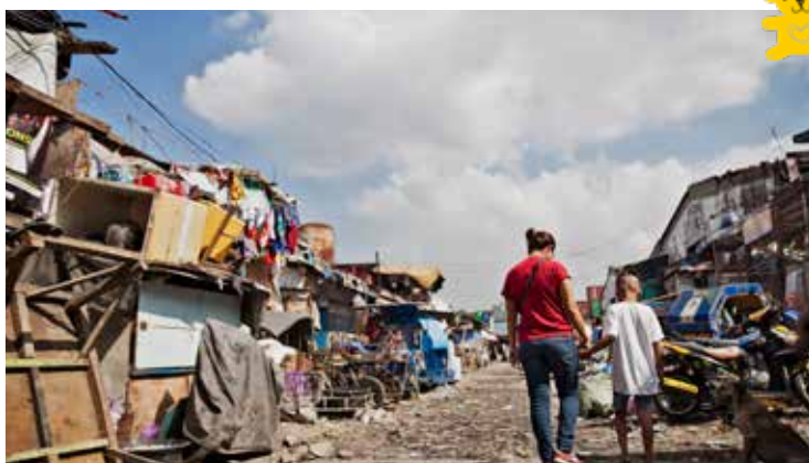
SAMMA HIMMEL. SAMMA RÄTTIGHETER. VERKLIGHETEN SER OLIKA UT.

Att vara kyrka är en styrka i sammanhanget. Samarbetet med ACT-alliansen, ett nätverk med över 150 kyrkor och trosbaserade utvecklingsaktörer,