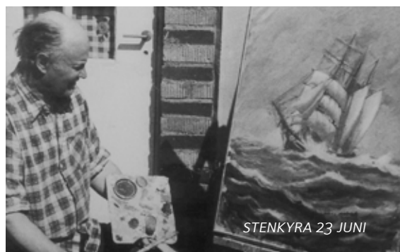
STENKYRKA 23 JUNI