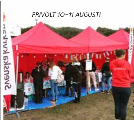
FRIVOLT 10-11 AUGUSTI