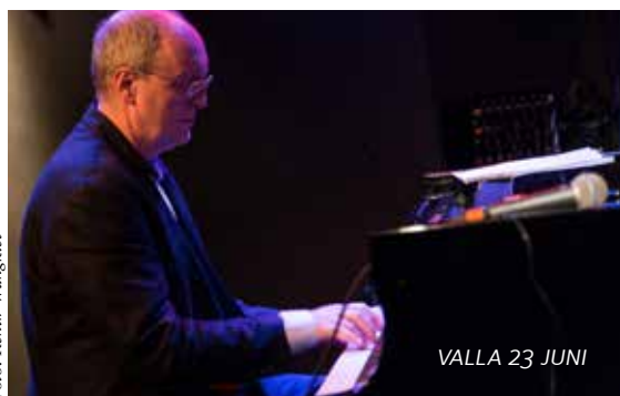
VALLA 23 JUNI