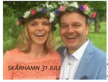
SKÅRHAMN 31 JULI