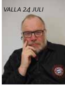
VALLA 24 JULI