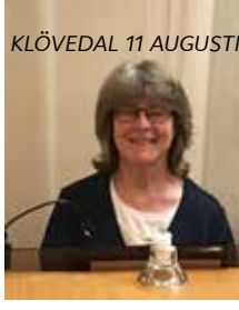
KLÖVEDAL 11 AUGUSTI