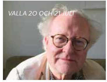
VALLA 20 OCH 21 JULI