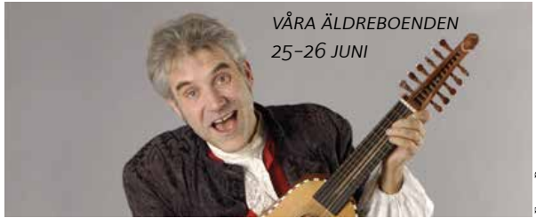
VÅRA ÄLDREBOENDEN 25-26 JUNI