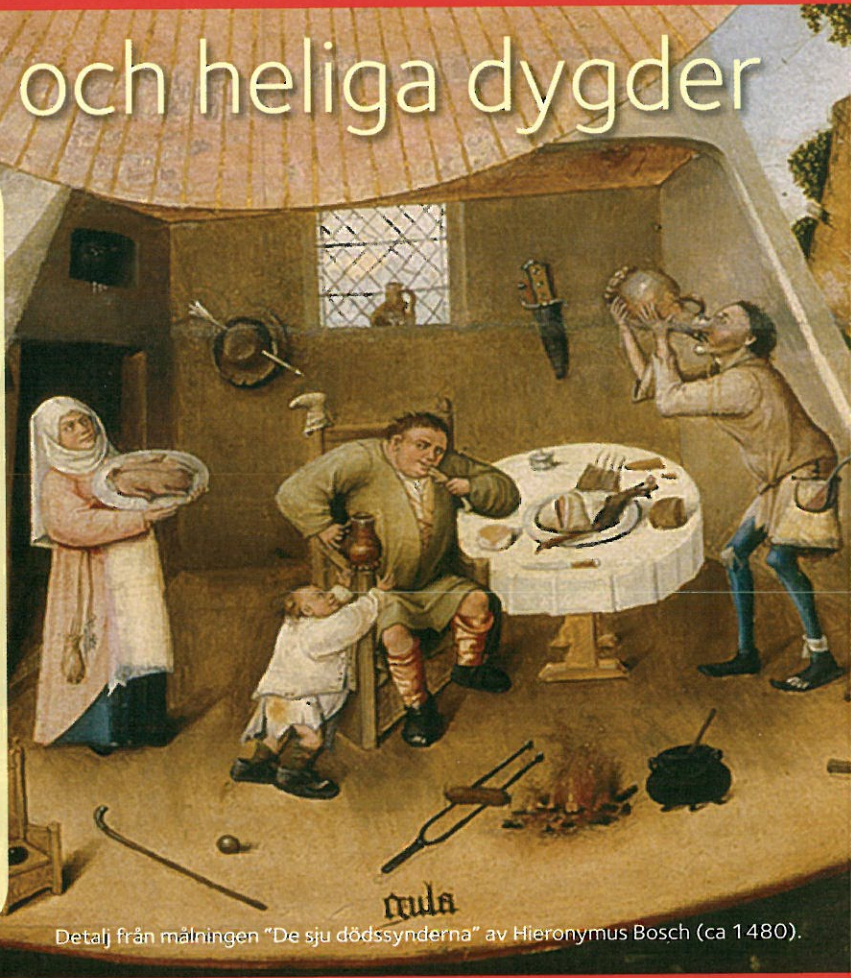
Detalj från målningen "De sju dödssynderna" av Hieronymus Bosch (ca 1480).