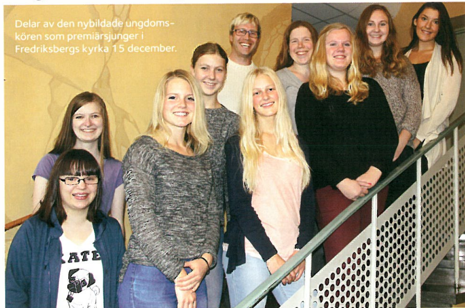
Delar av den nybildade ungdoms- kören som premiärsjungler i Fredriksbergs kyrka 15 december.