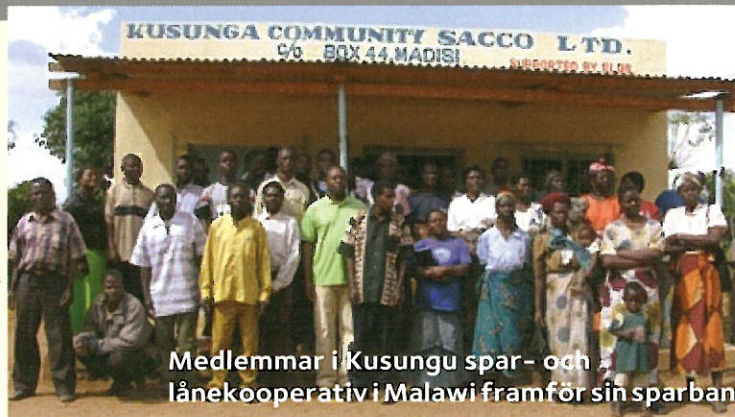
Medlemmar i Kusungu spar- och lånekooperativ i Malawi framför sin sparbank

gör det möjligt för dess 1000 kronor för att köpa mat eller förbättra boendet. Förutsättningar för hållbar utveckling till små lån går hand- lingsmedlemmar utbild- ade och betalar nu inte bara sin andelen av vinsten. Tack medlemmar mindre sårbara för klimats förändringar, som till exempel