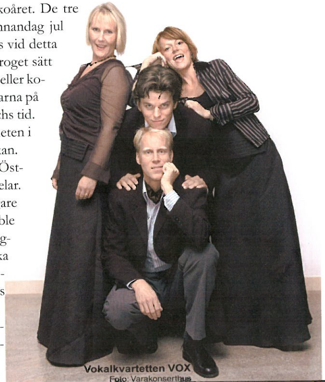
Vokalkvartetten VOX

Biljetter kommer att säljas på pastors-expeditionen i förväg och i Fredriksbergskyrkan på konsertdagen.