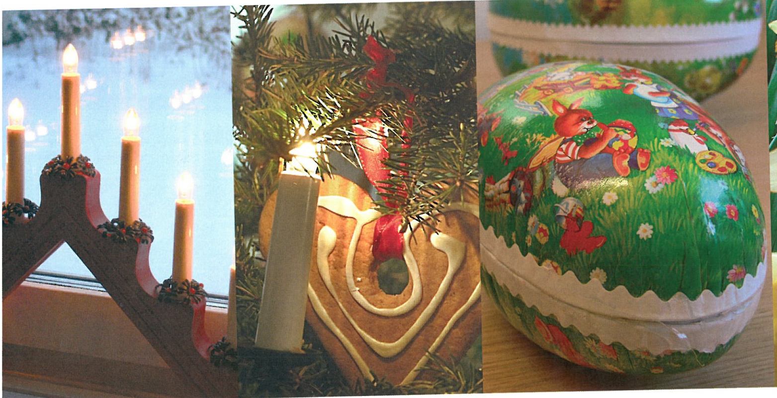
Foto: Jim Elfström (IKON), Ezzard Malmbergh (APT) och Catarina Ström Text: Gunilla Balutia