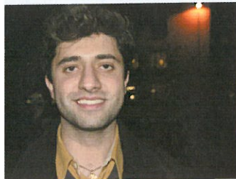
San Sheikhan, Falköping

firar tillsammans med familjen traditionell jul men inte så mycket TV-tittande. Vi spelar spel så kommer tomten.