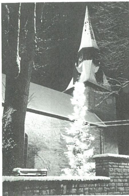
Julstämning från S:t Olofs kyrka.