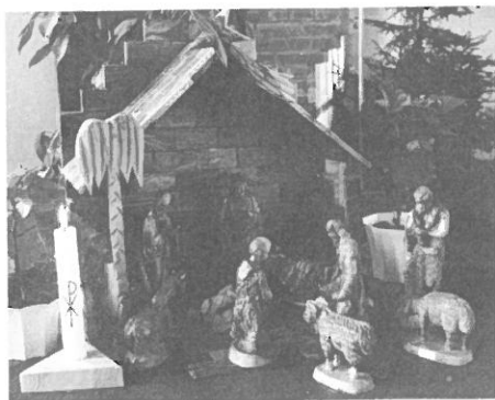
Mössebergs kyrkas julkrubba.

långtråkigt. Men så är det ju med allt som man inte förstår eller följer med i. Varje söndag griper tag i nästa och bildar ett drama där den levande uppståndne Jesus Kristus vandrar med oss och berättar för oss vad Han har gjort för oss genom sitt liv, sin död, sin uppståndelse och himmelsfärd.