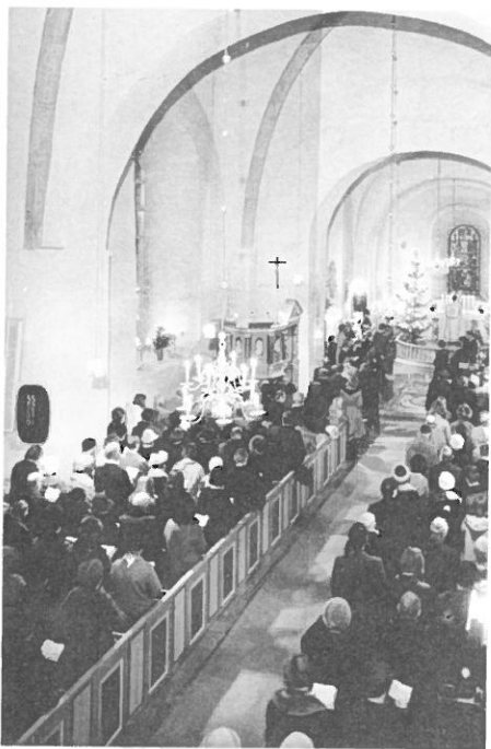
Julotta i S:t Olofs kyrka.