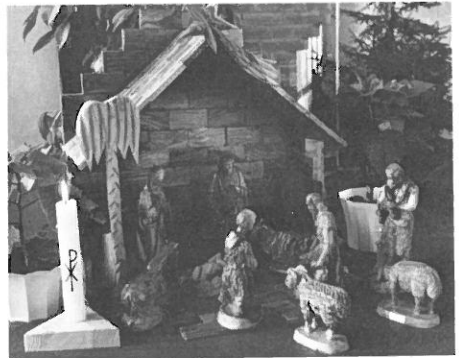
Julkrubban från Israel i Mössebergs kyrka.

Anmälan till pastorsexp. 170 30 senast den 17 december.