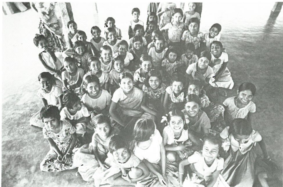
Falköpings pastorats söndagsskolorbarn har regelbundet samlats till barn i Indien. Barnen här vill uttrycka sin glädje och sin gemenskap med varandra.

Zimbabwe/Rhodesia: Regeringen har beordrat den evangelisk-lutherska kyrkan i Zimbabwe att stänga sjukhuset i Manama. Också på andra håll har missionens sjukvård lidit kraftiga avbräck genom inbördeskriget. Skolor och kapell har plundrats, och församlingsarbetet fortskrider under stora yttre svårigheter. Tre lutherska präster och en ungdomsledare som har varit politiska fångar men genom SKM:s försorg blivit frigivna, har tillsammans med sina familjer vistats i Sverige och