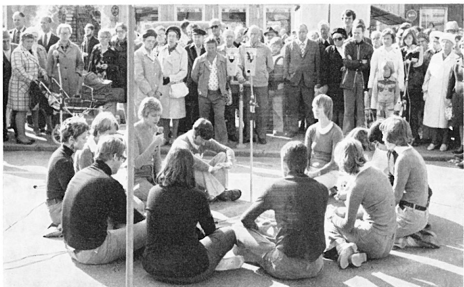
På Stora Torget framförde Skara stifts kyrkospel "På marken". Av Ylva Eggehorn.