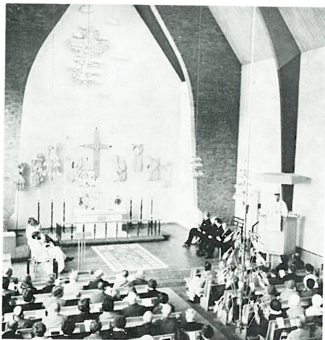
Från invigningen i Mössebergs kyrka av konstverket "Kristi återkomst".

NR 4 ADVENT - JUL - TRETTONDAGSTID 1975—76