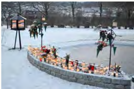
Minneslunden i Skön