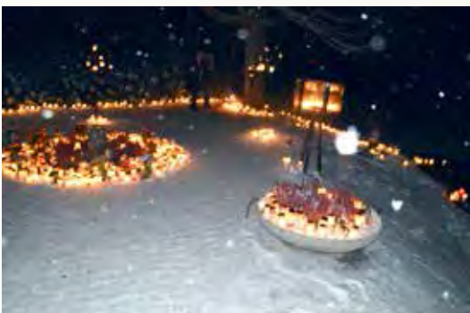
Bäcklunden i Bydalen