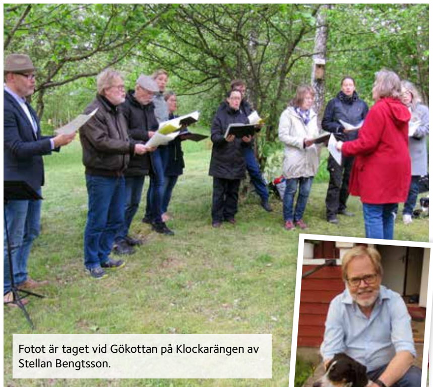
Fotot är taget vid Gökottan på Klockarängen av Stellan Bengtsson.

Jag började sjunga i kyrkokören 1969, men innan dess sjöng jag i barnkören.