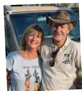
Afrikahuset 22 okt