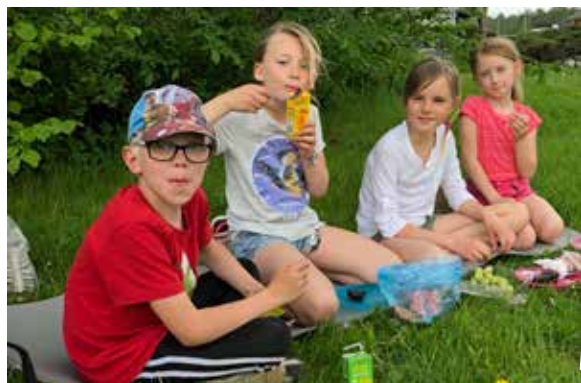
Avslutningfika ute i det fina vädret.

Ibland sjunger barnen under söndagsgudstjänster men i höst får vi även se andra delar av kyrkans verksamhet. Vi sjunger under Messy church (läs mer i rutan här bredvid) och kommer också vara med under veckomässan i december som blir något utöver det vanliga. Det blir många kända, traditionella julsånger där alla är välkomna att sjunga tillsammans med oss.