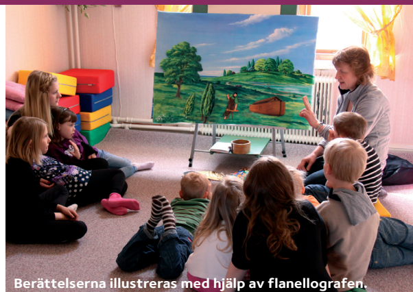
Berättelserna illustreras med hjälp av flanellografen.

Efter uppdelningen avslutas söndagsskolan med en samling där alla sjunger en sång tillsammans och till slut blir det klistermärkesutdelning innan barnen springer ut i den sköna vårsolen.