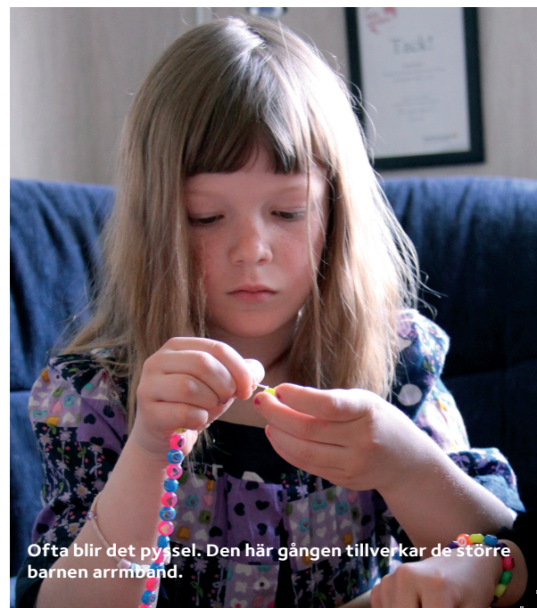
Ofta blir det pyssel. Den här gången tillverkar de större barnen armband.