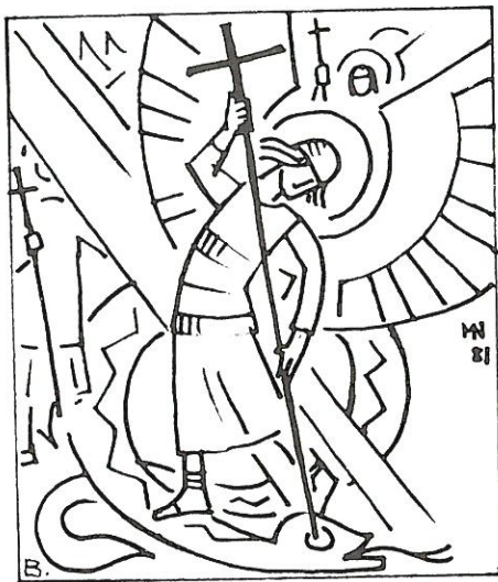
Mikael strider mot draken.

I Uppenb. 7 står det: ”Och jag såg en annan ängel stiga fram från öster med den levande Gudens sigill, och han ropade med hög röst till de fyra änglarna som hade fått rätt att skada jorden och havet: ”Skada inte jorden