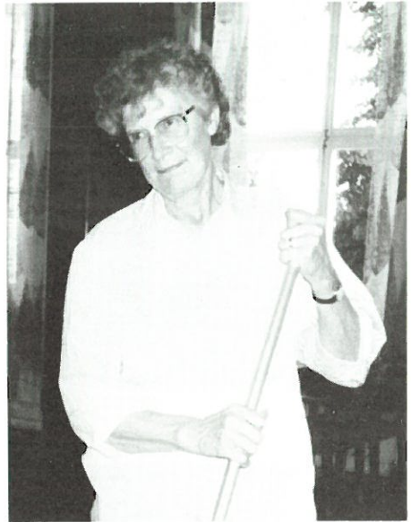
Till allas vår trivsel.

Att städa i en kyrka ger också själen kraft och styrka påminner om livets allvar men också om vilken stor Gud vi har.