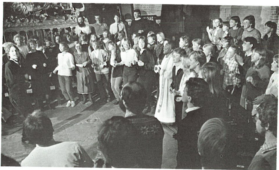
Fredsgudstjänsten i Storkyrkan med biskop Tutu.

”Undantagstillståndet är en desperat handling av myndigheterna. Med det försöker de stoppa den oundvikliga frihetsvägen.