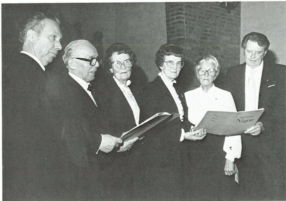
Några av de första medlemmarna i Mössebergs kyrkokör.