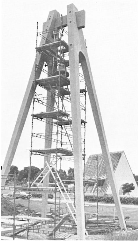
Den nya klockstapeln på S:t Olofs kyrkogård som invigdes av kontraktsprosten Uno Mårtensson den 17 sept. 1983.

om åtgärders vidtagande med detta vägstycke — skulle för närvarande få förfalla”.