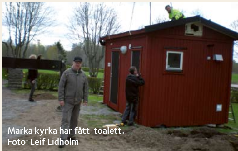
Marka kyrka har fått toalett.