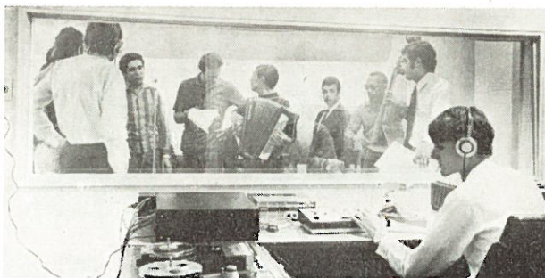
Glädjens budskap för de fattiga