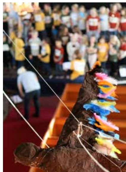
Örnen svävar högt ovanför kyrksalen i sången "Över land och hav"