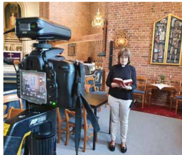
Filmning inför påsken i Snöstorps kyrka