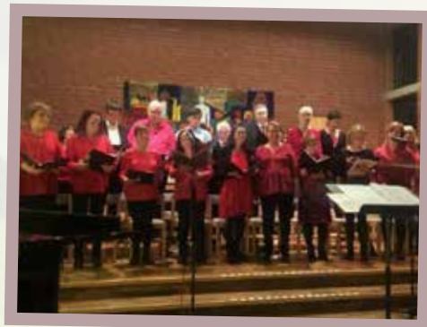
Gospelkören Sing for Joy