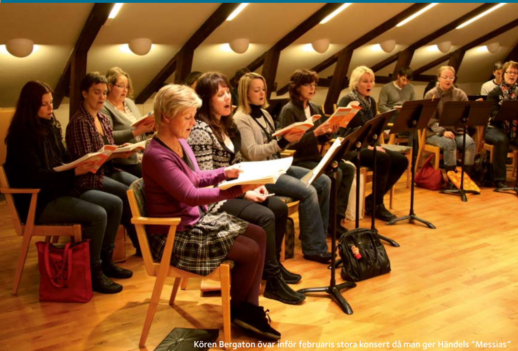
Kören Bergaton övar inför februaris stora konsert då man ger Händels "Messias"

Ola. Genom körledaren får vi kontakt med bra musiker. Det blir kvalitet i det vi gör. Det är lätt att tro att en kantor