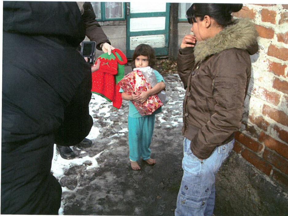
Fattigdomen är stor och de som drabbas värst är barnen.