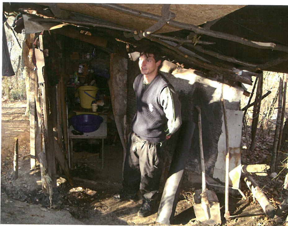
Bostäderna är ofta byggda av vad man kan hitta och mycket dåliga på att hålla värmen.

– Men de var roligt att se att pengarna som skänks här i Sverige verkligen kommer fram till dem som behöver det.