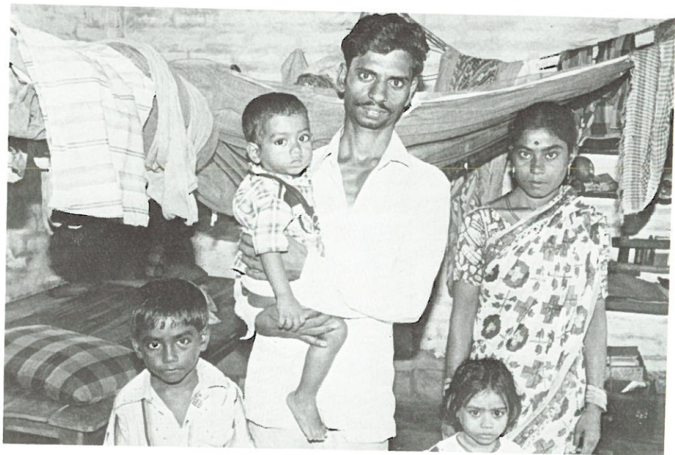
Familj i Salt Lake City, Calcutta.