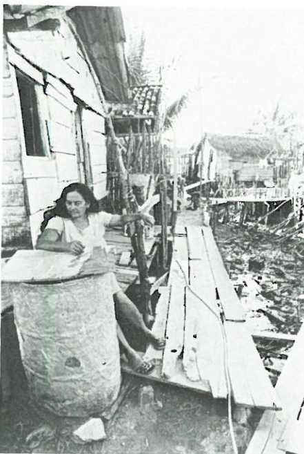
Slummiljö i Recife, Brasilien.

När detta skrivs (november) väntar två svenskar på visum till Pakistan. Läkaren