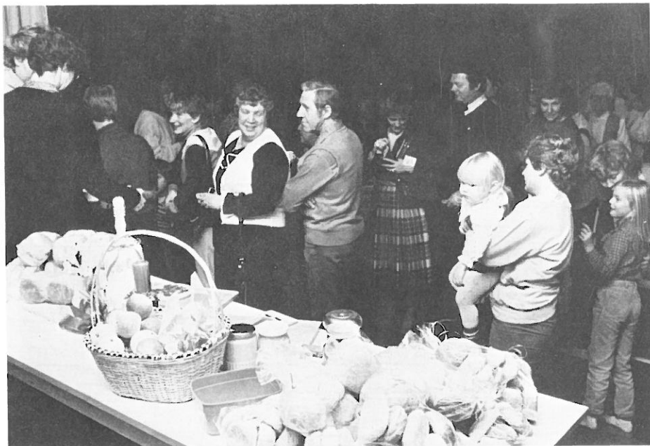
En traditionell viktig del av händelserna i ett församlingshem brukar vara den årliga syföreningsauktionen, som fortfarande betyder mycket för att ge Lutherhjälpen och Missionen resurser att hjälpa.

jämning inom Svenska kyrkan behövde församlingen inte höja utdebiteringen utan klarade utgifterna med oförändrad skatt.