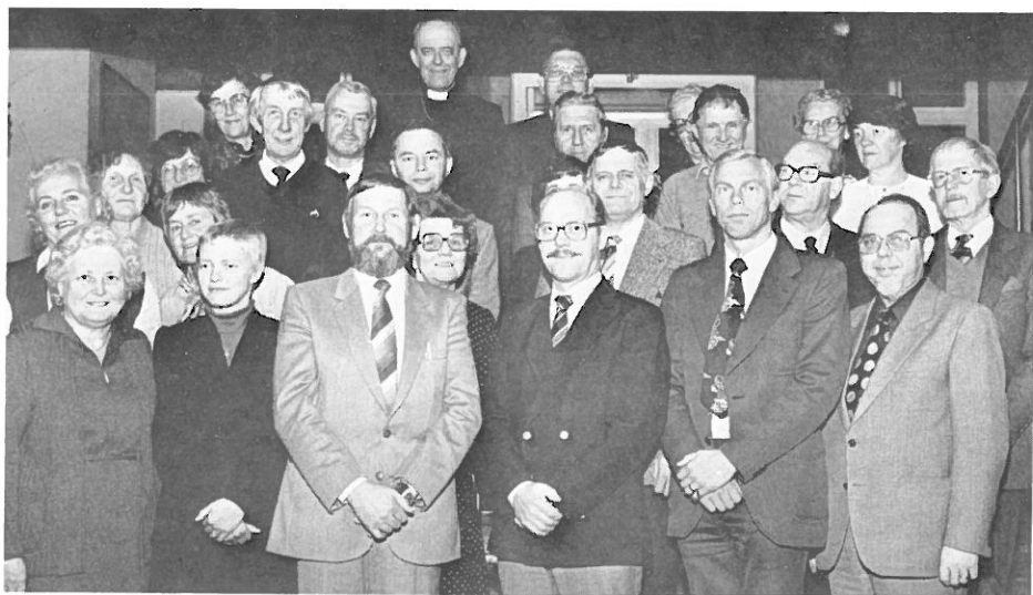
De närvarande församlingsdelegerade vid deras första sammanträde i december.